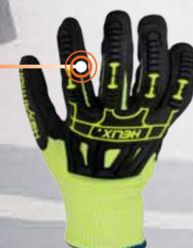
Rękawice do prac w trudnych warunkach Helix 3000 EN 388:2016 (4 X 4 2 D P)