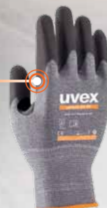
Rękawice do prac z ostrymi elementami uvex athletic D5 XP EN 388:2016 (4 X 4 3 D)