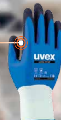
Rękawice do prac z wodą i betonem uvex unilite 7710 F EN 388:2016 (4 1 2 1)