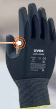
Rękawice do prac ogólnych uvex unilite 6605 EN 388:2016 (4 1 2 2 X)