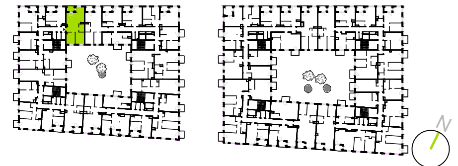
SCHEMATYCZNY RZUT KONDYGNACJI: